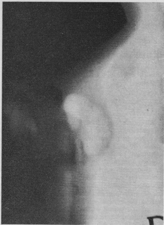
Fig. 2. — Stratigrafia.