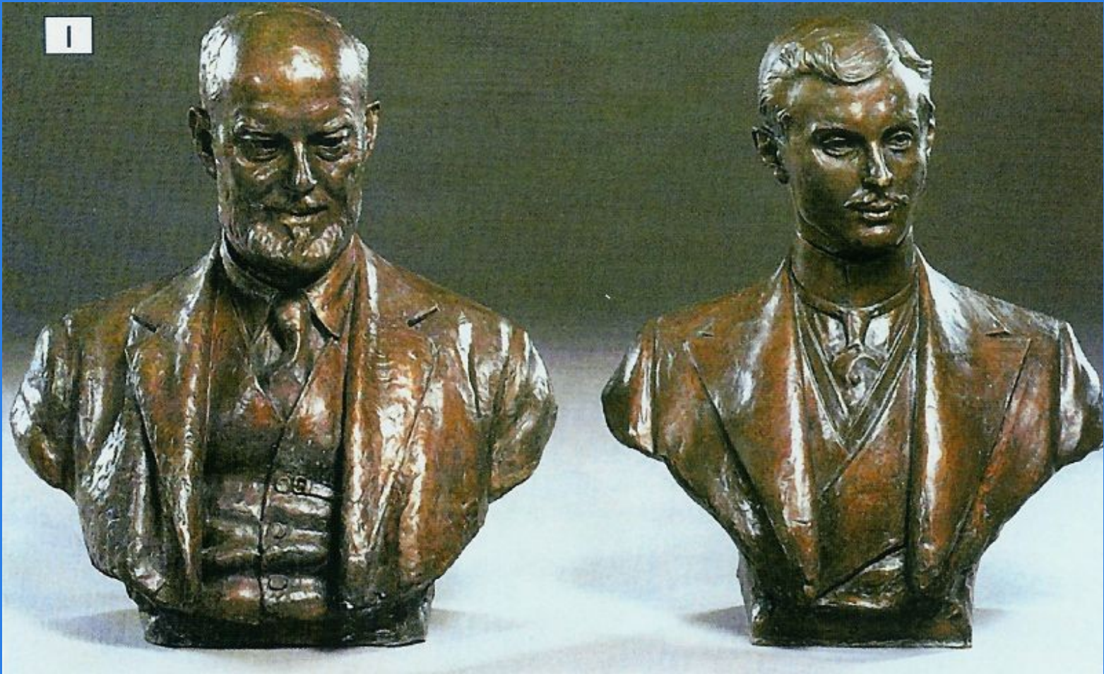
Sir Henry Royce - Hon. Charles Rolls 1863-1933 1877-1910