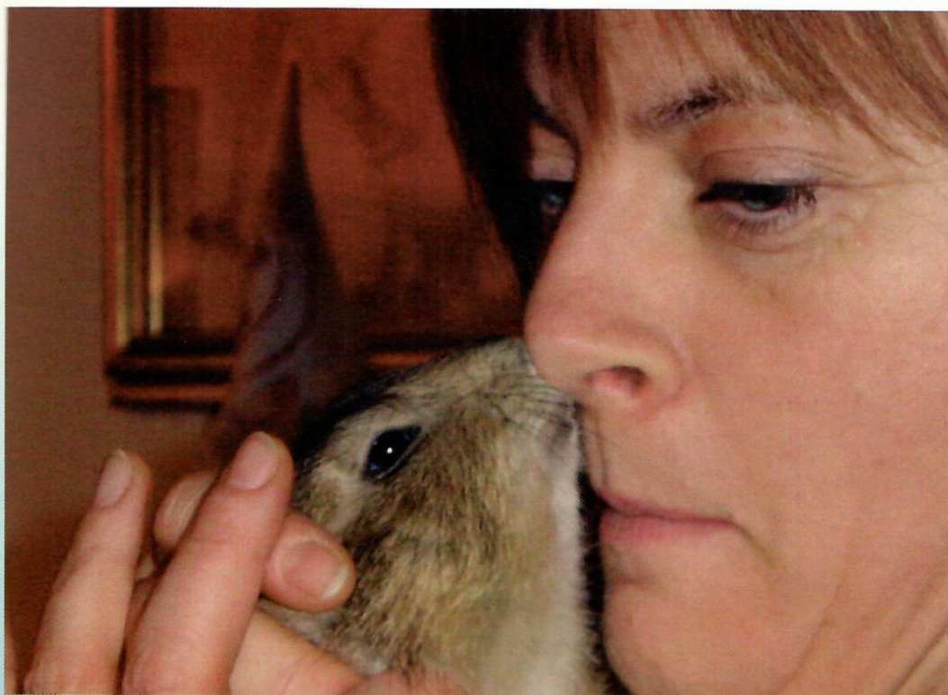
Affettuosità e coccole reciproche.