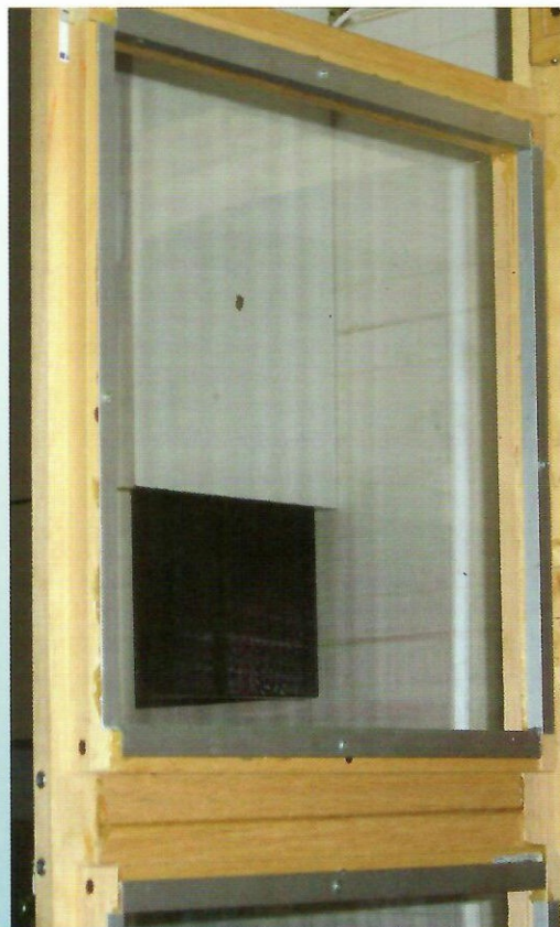
L'alluminio come protezione.

Concludendo, dobbiamo ricordarci che il Cane della Prateria è sì un animale che da soddisfazioni enormi, ma che in cambio richiede delle attenzioni ed impegni sicuramente superiori a conigli e cavie. Non può essere paragonato a nessun'altro